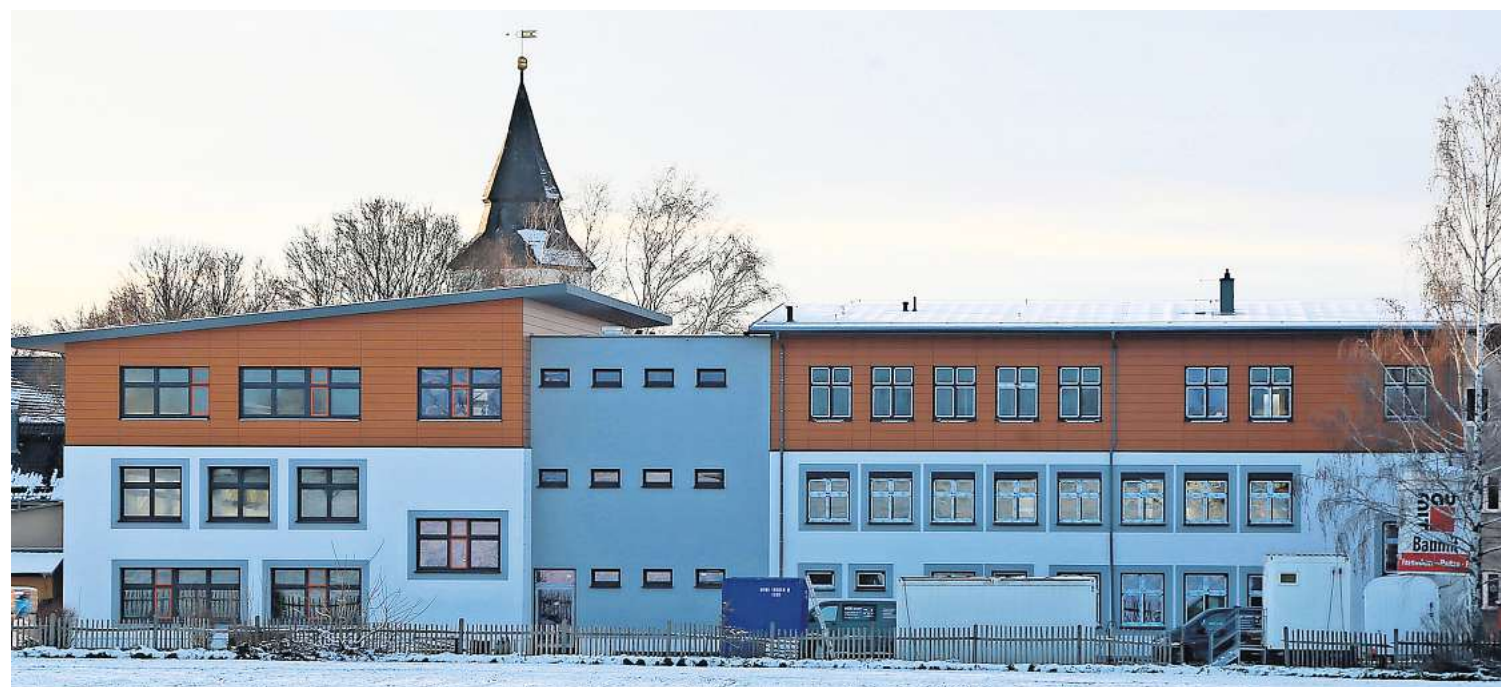
Die Staatliche Grundschule Nobitz besteht künftig nur noch aus dem Neubau links und dem umgestalteten Gebäude 3, beide über einen Mittelbau miteinander verbunden.

Nobitz. Am Sonnabend brannte gegen 7 Uhr in der Schulstraße eine Mülltonne. Die Feuerwehr löschte den Brand, die Tonne wurde beschädigt, teilte die Polizei gestern mit.